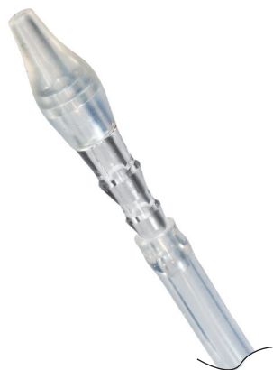
吸引チューブ装着例